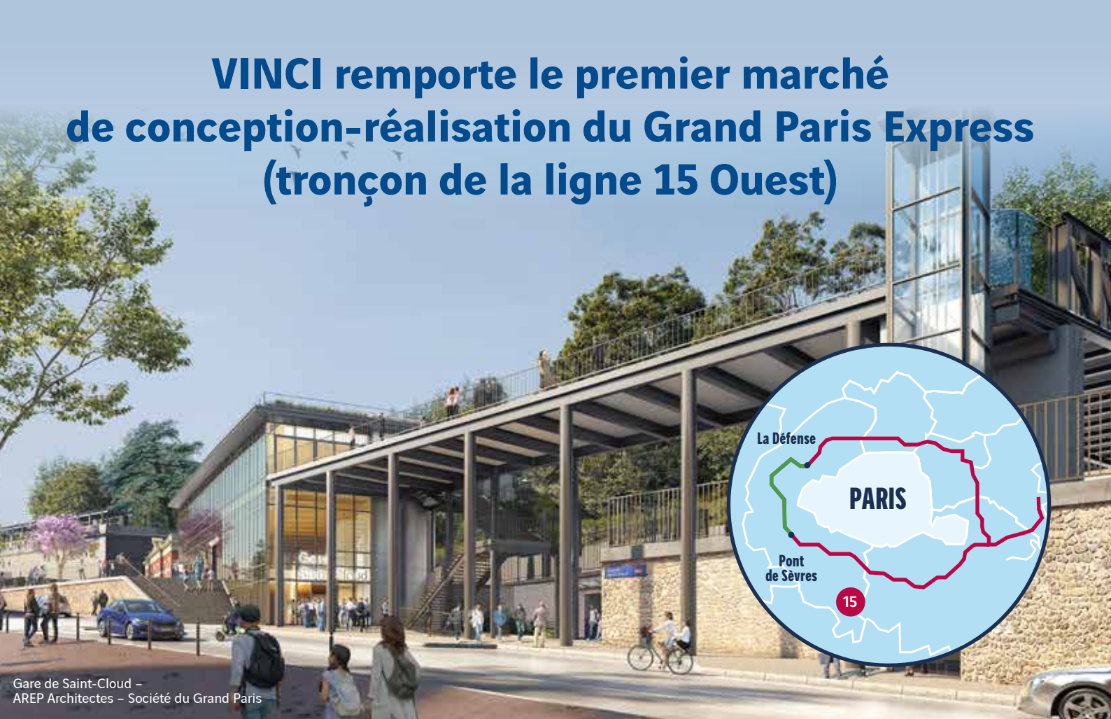
Gare de Saint-Cloud – AREP Architectes – Société du Grand Paris